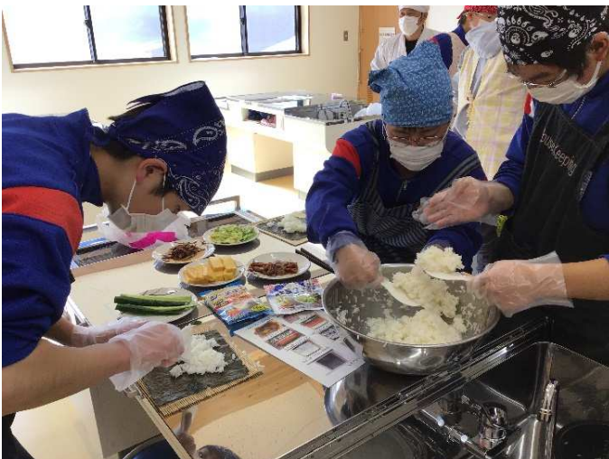
手順に沿って自分たちで進めていく。