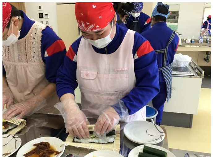
酢飯と具材の分量バランスを考えて…。