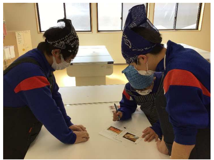
自分たちで話し合っ役割分担を決める。