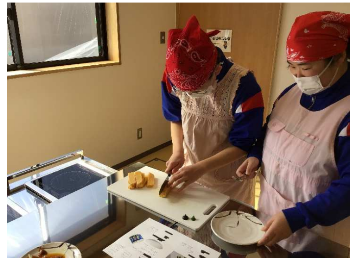
具材を人数分で等分するには？！