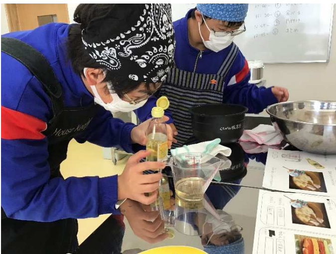
数学で学習した「かさ」を思い出して…。