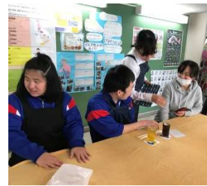
〈手工芸班〉キーホルダー、巾着、ハーバリウム等の販