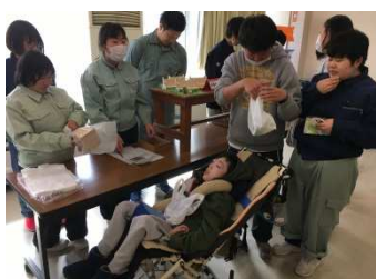
〈木工班〉スプーン、スマホスタンド、小物ベンチ、ペン立ての販売

各班大盛況であった作業班の販売会が行われました。販売会では、前半／後半で交代しながら【お客さん】と【店員】を体験しました。お客さんの目線で製品を見たり、自分達で作った製品を喜んで買ってもらえることの達成感を味わったりできる、貴重な学習の機会となりました。どの班も趣向を凝らした製品づくりやサービスでした！